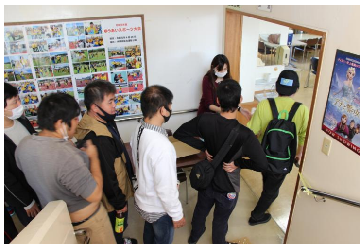
映画チケットを配布

令和3年1月16日(土)に、「たまん」施設内の食堂を映画館に見立て、余暇活動(映画鑑賞会)を行いました。食堂の入口にて「入場券」と「ポップコーン引換券」を支援員から受取り、自分の席を探しながら入場する姿はどこかワクワクとした表情がうかがえました。ポップコーンの香ばしい香りに誘われて早速「引換券」を使用し、食堂の一角にあるポップコーンの屋台には行列ができていました。いよいよ映画(アナと雪の女王)が始まるとポップコーンを食べながら、皆さんニコニコと鑑賞している様子が印象的でした。ミニシアターが終わると次はお待ちかねのお食事タイムです。今回はマクドナルドで注文したエッグチーズセットを楽しい雰囲気の中で美味しく食べていました。和気あいあいと充実した様子で過ごすことができました。