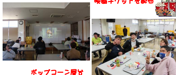
ポップコーン屋台